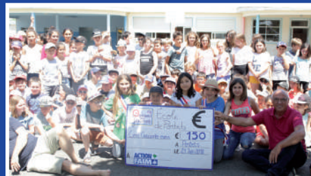
Participation à l'opération «Bol de Riz»