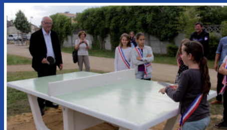
Installation d'une table de ping-pong au parc du Chéret