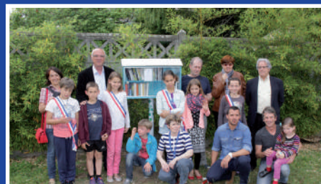
Mise en place d'une boîte à livres