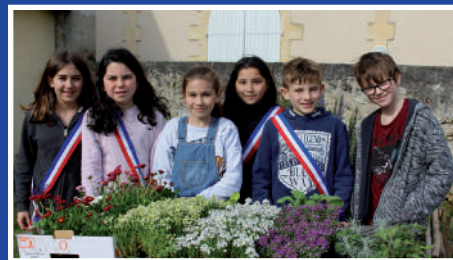
Création d'un jardin partagé