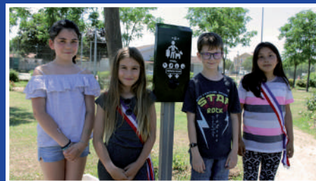
Mise à disposition de sacs pour les déjections canines