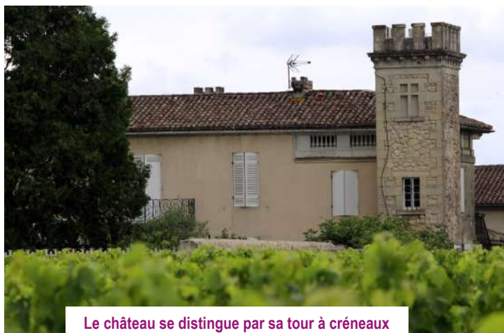
Le château se distingue par sa tour à créneaux