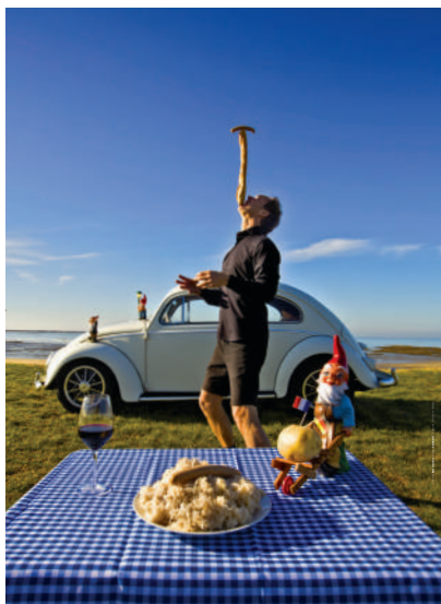
Un spectacle inclassable proposé gratuitement pour l'ouverture de saison

Pour aller plus loin : www.espacelaforge.fr