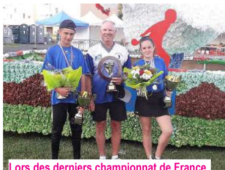
Lors des derniers championnat de France