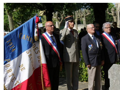
Cérémonie du 8 mai à Portets Les Anciens Combattants présents au côté du Maire